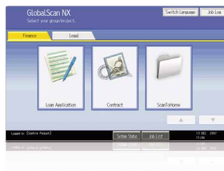
Interfaccia grafica (GUI) intuitiva

La soluzione intuitiva GlobalScan NX razionalizza il flusso di lavoro grazie a funzionalità flessibili di scansione e distribuzione. L'interfaccia grafica utente (GUI), molto facile da utilizzare, consente di memorizzare delle icone con impostazioni personalizzate relative al formato ed al flusso dei documenti. Dal pannello di controllo di MP C2050 e MP C2550 è possibile eseguire direttamente scansioni in un solo passaggio.