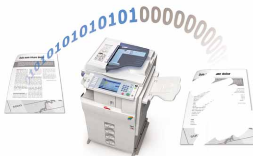
Sovrascrittura dei dati sul disco fisso

Le funzionalità di autenticazione e codifica dei dati proteggono le informazioni riservate. MP C2050 e MP C2550 sono compatibili con sistemi di sicurezza opzionali che permettono la sovrascrittura dei dati sul disco fisso, la protezione dei dati contro la copiatura, l'autenticazione tramite card e l'autorizzazione alla stampa.